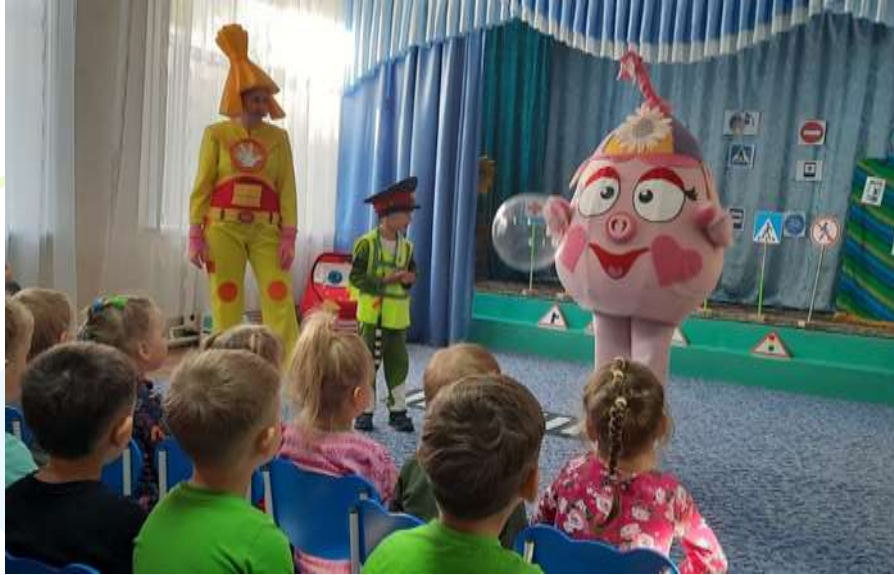
Развлечение «Смешарики в гостях у ребят»