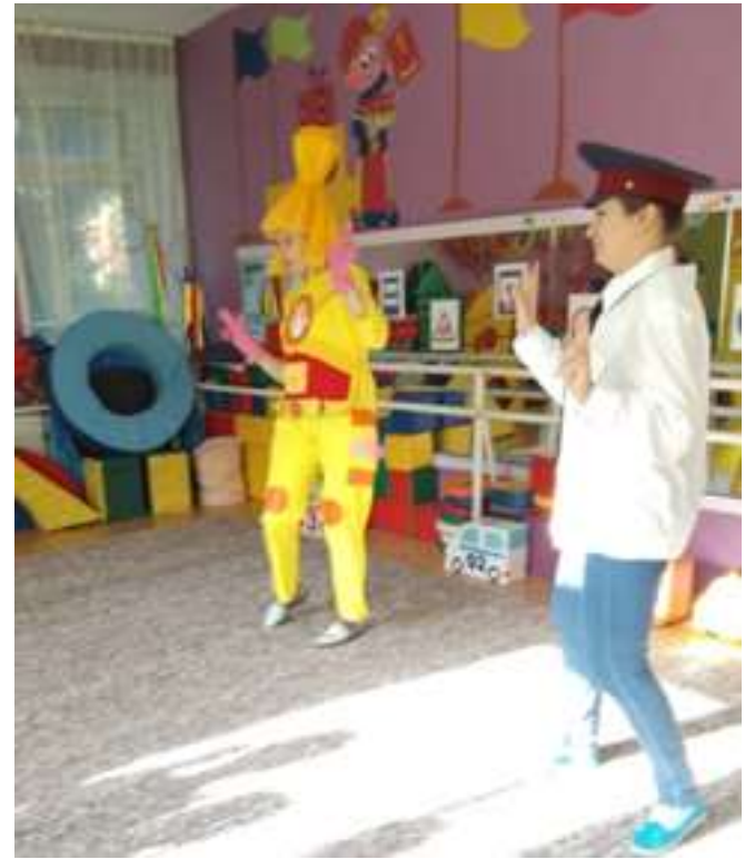
Развлечение «Симка спешит на помощь»